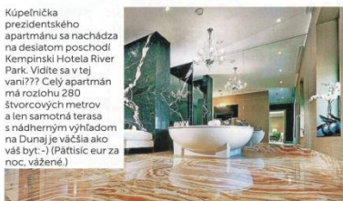
Kúpeňníčka prezidentského apartmánu sa nachádza na desiatom poschodí Kempinski Hotelu River Park. Vidíte sa v tej vani??? Celý apartmán má rozlohu 280 štvorcových metrov a len samotná terasa s nádherným výhľadom na Dunaj je väčšia ako váš byt... (Pattisic eur za noc, vážene.)