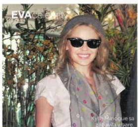
Kyša Minogue sa zúčastnila výbave.